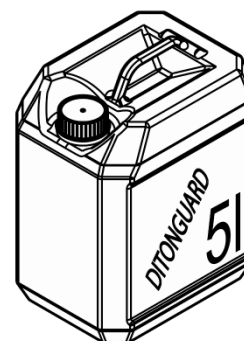
Obr. č.2 DITONGUARD 5L