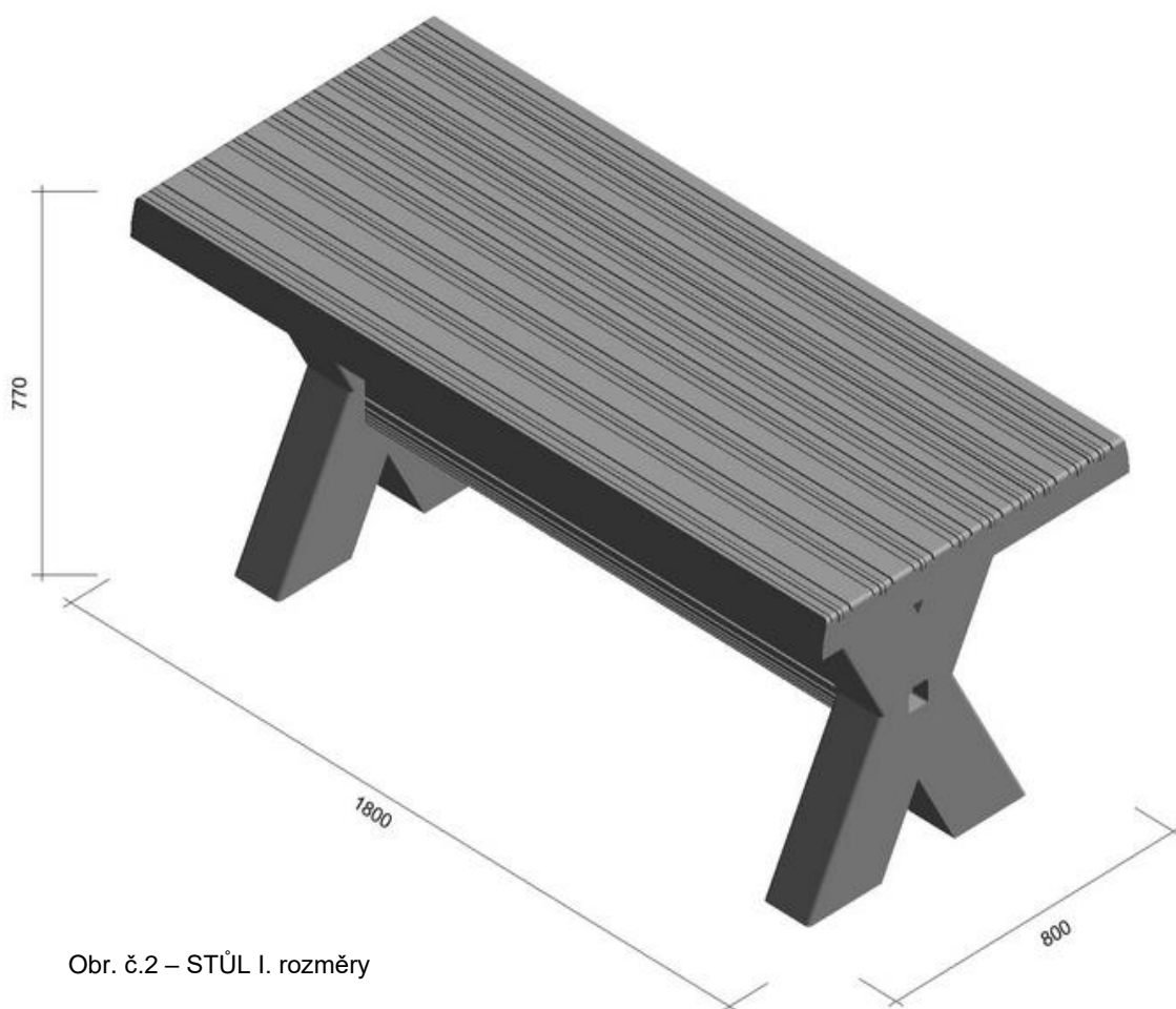
Obr. č.2 – STŮL I. rozměry